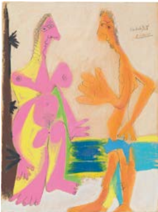
1252, Pablo Picasso Homme et femme nus debout / Mann und Frau, stehende Akte, 1969, Gouache, Fettkreide, Bleistift auf Karton