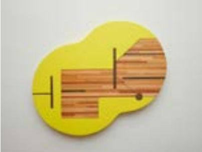
Innere Struktur eines BIGFET 2

Mittelpunkt seines künstlerischen Schaffens stellt seit mehr als 40 Jahren die Farbe Gelb dar. Wobei nicht die Absolutheit der Farbe, sondern die Vielfalt ihrer Ausdrucksmöglichkeiten als Grundlage dient. Fred Ziegler nutzt die Ambivalenz der Farbassoziation und lotet die Gegensätzlichkeit – Wär-