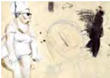
Über die moderne Kunst, 1980