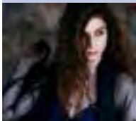
Reut Rivka

Gewölbekeller der Residenz, Residenzplatz 7